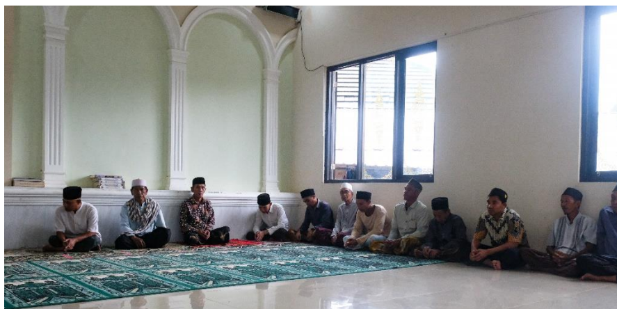
Gambar 2. Persiapan Peserta

Kemudian pelaksanaan pengabdian dilakukan dengan metode ceramah reflektif dari tim pengabdian. Ceramah reflektif ini mengajak peserta untuk menyadari bahwa kemegahan sejati sebuah masjid tidak diukur dari tingginya menara atau mewahnya karpets, melainkan dari seberapa besar perannya sebagai jaring pengaman sosial. Spiritualitas jamaah baru benar-benar paripurna ketika kesalahan di atas sajadah berbanding lurus dengan kepedulian nyata terhadap kemandirian ekonomi masyarakat di sekitarnya.