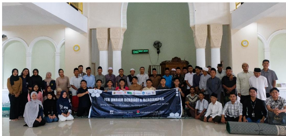
Gambar 4. Kegiatan Serah Terima Bantuan dan Foto Bersama

Dari sisi pengurus masjid, kegiatan ini membuka wawasan mengenai pentingnya perencanaan program masjid yang tidak hanya berorientasi pada kegiatan keagamaan rutin, tetapi juga menyentuh aspek kesejahteraan jamaah. Hal ini sejalan dengan konsep masjid sebagai pusat pembangunan masyarakat ( community development ). Secara konseptual, hasil pengabdian ini menguatkan pandangan bahwa optimalisasi fungsi masjid harus dimulai dari perubahan paradigma. Ceramah reflektif terbukti efektif sebagai media penyadaran awal. Meskipun kegiatan ini belum menghasilkan program pemberdayaan ekonomi yang konkret, namun telah membangun fondasi kesadaran dan komitmen kolektif yang sangat penting bagi keberlanjutan program di masa depan.