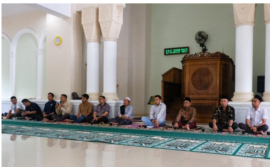
Gambar 3. Pelaksanaan Ceramah Reflektif kepada Jamaah Masjid

Kemudian pelaksanaan pengabdian dilakukan dengan metode ceramah reflektif dari tim pengabdian. Ceramah reflektif ini mengajak peserta untuk menyadari bahwa kemegahan sejati sebuah masjid tidak diukur dari tingginya menara atau mewahnya karpets, melainkan dari seberapa besar perannya sebagai jaring pengaman sosial. Spiritualitas jamaah baru benar-benar paripurna ketika kesalahan di atas sajadah berbanding lurus dengan kepedulian nyata terhadap kemandirian ekonomi masyarakat di sekitarnya.